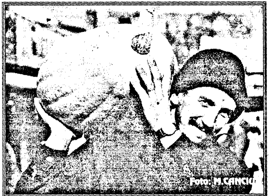
Avem și noi recordurile noastre: „dovleacul arădean”