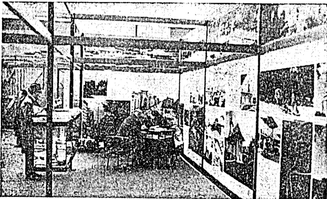
Recent s-a deschis la Bruxelles „Salonul Internațional de turism și vacanță” la care participă și România cu o expoziție organizată de O.N.T. Carpați, prezentînd fotografiile din orașe și regiuni ale țării noastre precum și obiecte de artă populară. IN FOTOGRAFIE: Aspecte de la expoziția românească.

HANOI 29 (Agerpres). — Mișcarea de legătură a înaltului comandament al Armatei populare vietnameze a adresat un mesaj de protest Comisiei Internaționale de supraveghere și control în Vietnam arătînd că avioane americane decolînd de pe baze situate în Vietnamul de sud și Tailanda, precum și de pe portavioanele floatei a 7-a a SUA, au pătuns de repetate ori în zilele de 27 și 28 martie, în spațiul aerian al RD Vietnam și au bombardat și mitraliat puncte populate și obiective industriale din provinciile Ha Tinh și Quang Binh.