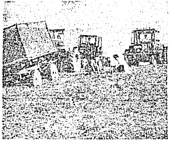
I.A.S. Șagu. Se acționează cu forțe sporite la strîngerea și depozitarea furajelor.