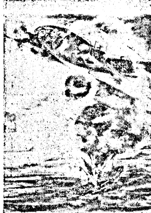
Atacul unui avion de bombardament german, împotriva unui convoi britanic.