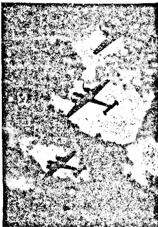
O escadrilă de bombardiere germane în drum spre Anglia.

Există totuși perspectiva, că tratativele vor fi reluate în cel mai scurt timp.