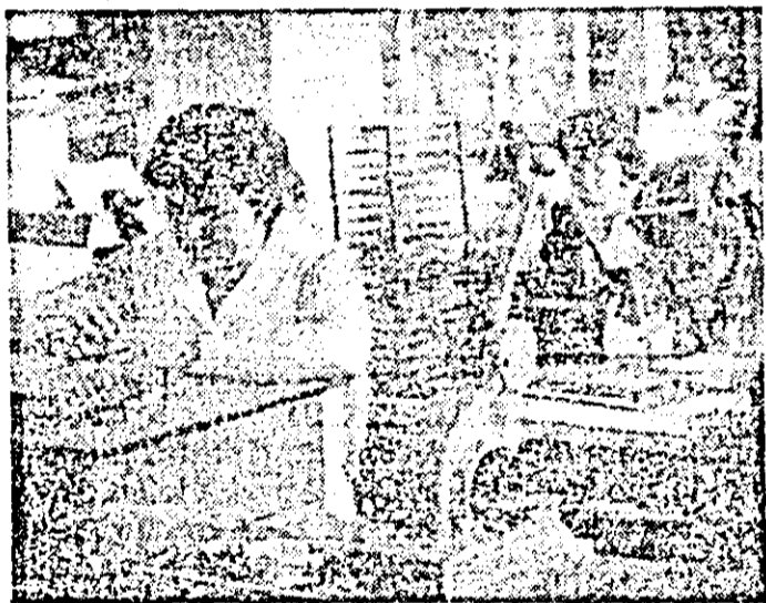
Și în atelierul montaj ansamble balans al întreprinderii „Victoria” întrecerea socialistă se desfășoară cu însuflețire.