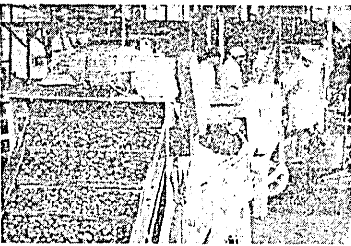
La I.P.I.L.F. „Refacerea” a început producerea pastei de roși din producția de roși '81.