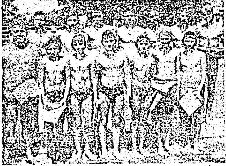
Formația de copii Rapid I, câștigătoare „Cupa Aradului”.

în finală și-au măsurat forțele copiii de la Rapid I, cu formația de polo din Tîrgu Mureș. Obținînd o frumoasă victorie, formația Rapid I s-a clasat pe primul loc, urmată fiind de Tîrgu Mureș și „Progresul” Oradea. Competiția de polo, de un bun nivel tehnic și spectacular, a fost dotată cu „Cupa Aradului”.