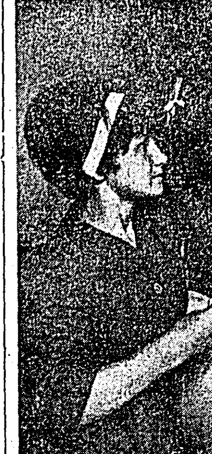
„TRICOUL ROȘU” — Aspect cotidian al secției Raschel.