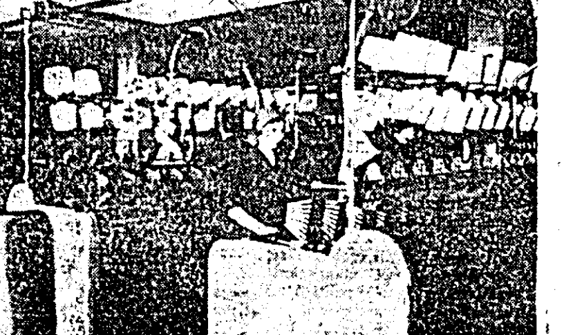
În atelierul școlii, elevii deprînd tainele meseriei.