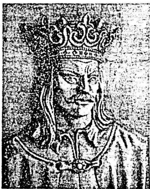
„Ștefan cel Mare” — sculptură de Grigore Pop.