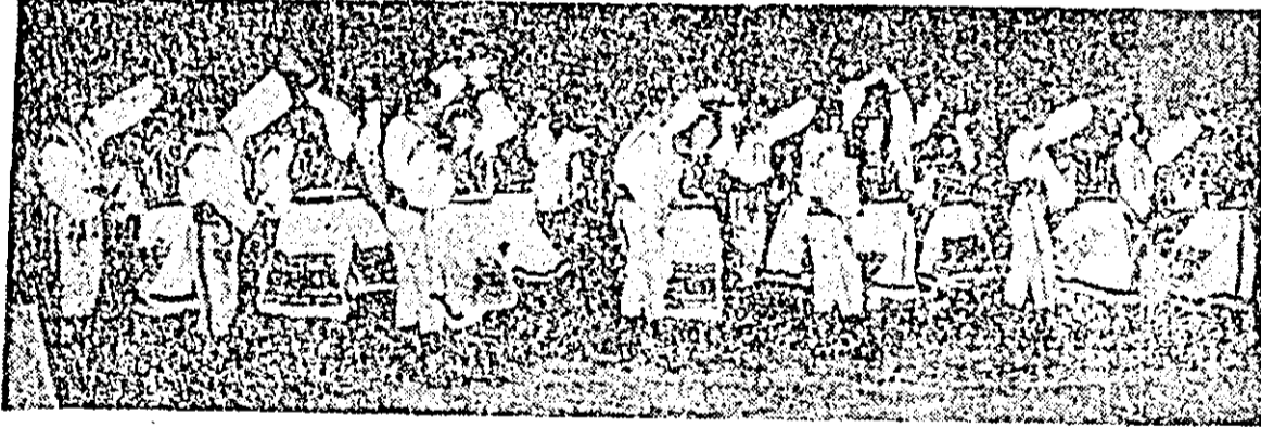
Ansamblul de cîntec și jocuri populare al sindicatului întreprinderii de vagoane Arad.

lui spiritual al șoptiste. Cum era și de rul acordă un parandiel din instituție pedagogică, care a avut tor nu numai la vîțătorilor pește nești, dar s-a puternic centru această parte a în perioada evoluției de la me- meinică cercetător autor în valoros arhivă din țară Prin conținutul mentele inedite zilia cititorului Popeangă vine cu cunoștințele noștrii perioada frământă meleagurilor a-