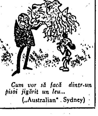
Cum vor să facă dintr-un pisoi jigarit un leu... („Australian”. Sydney)