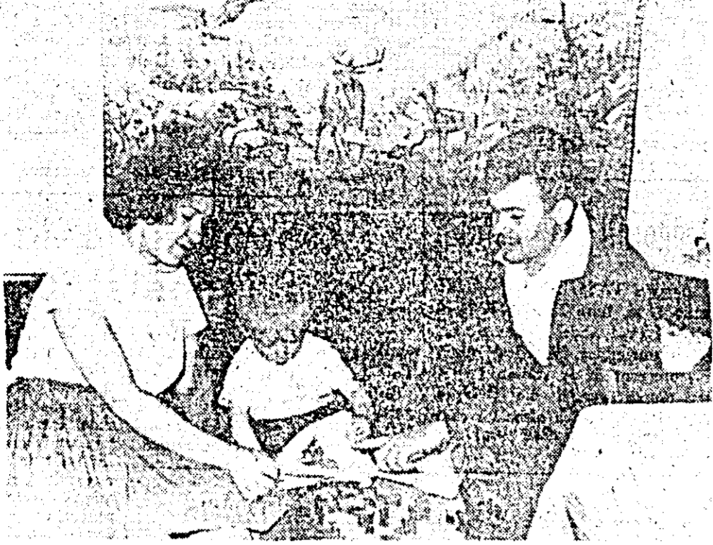
În casa cu nr. 44 de pe str. Bradului orele după-amiezii sînt bogate în fapte.

Dorind să împărtășim tinerilor citorii câteva din marile satisfacții ale căsniciei, am efectuat o anchetă în rândul tinerilor căsătorii, adresându-le întrebarea: „Ce v-au oferit primii ani de căsnicie? În cele ce urmează prezentăm câteva din răspunsurile primite.