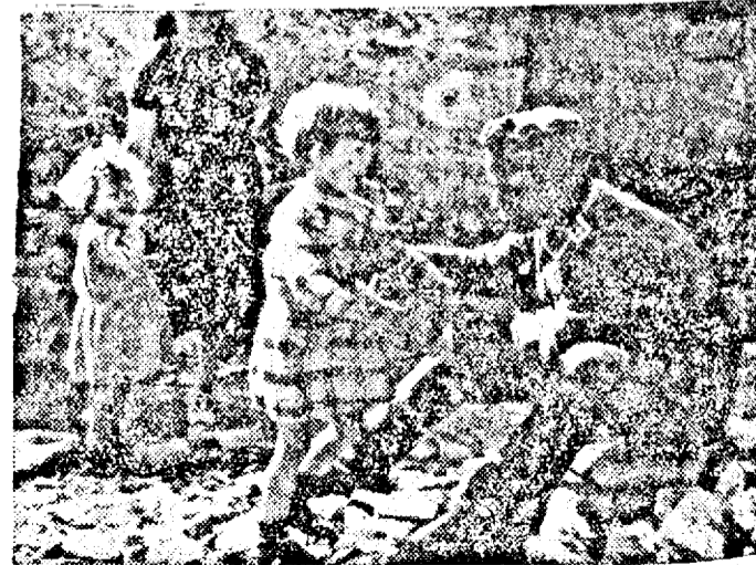
Copiii francezi se împrietonesc repede cu soldații mamei de ocupație germane