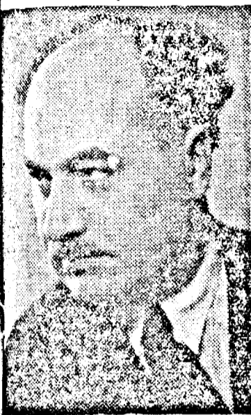
D. prof. Nichifor Crainic Ministru Propagandei Naționale

Impresionantele declarații făcute de d. ministru prof. Nichifor Crainic la Brașov