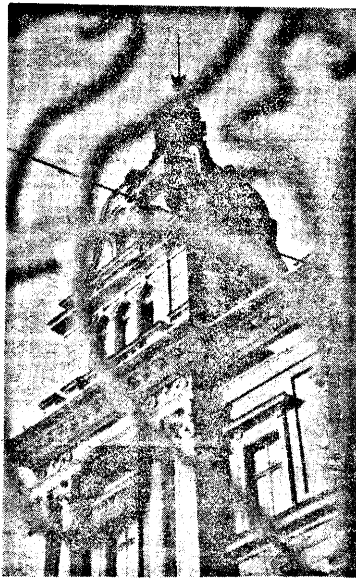
Detaliu de arhitectură arădeană în viziunea fotoreporterului nostru M. Canciu.