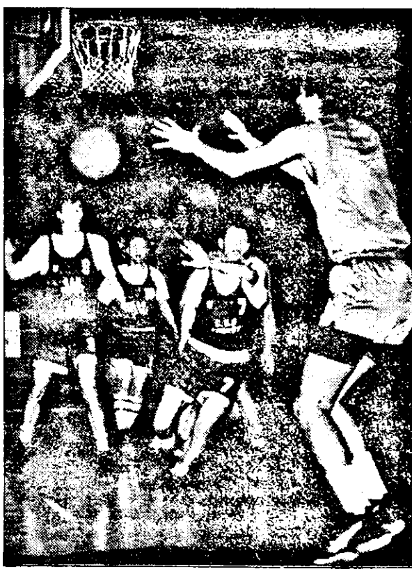
Smeu și compania nu măine doar o alternativă.

etapă în deplasare, la Iași, iar în cea de-a doua pe propriul teren, împotriva studenților de sub Feleac. Așteptăm, însă, replica echipelor noastre, a căror stare de spirit este favorabilă. BC ICIM pleacă la Brașov animată de calificarea din cupele europene și victoria detașată din jocul cu Rapid. Pe de altă parte, petroliștii, deși dezavantajați de înfrângerile suferite la Cluj și București (în meciul din Capitală arădenii au ținut piept campionilor până în min. 38!), vor pași hotărâți pe pardoseala Sălii Sporturilor „Victoria”, în dorința dobândirii succesului. Încheiem cu precizarea că meciul de la Arad va avea loc la ora 10,30 și cu obișnuita urare adresată înaintea unor asemenea confruntări: mult succes, echipelor arădene!