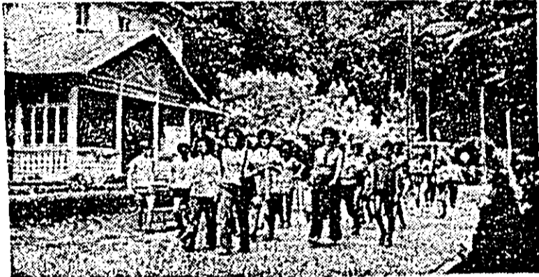
Moneasa — zile de vacanță