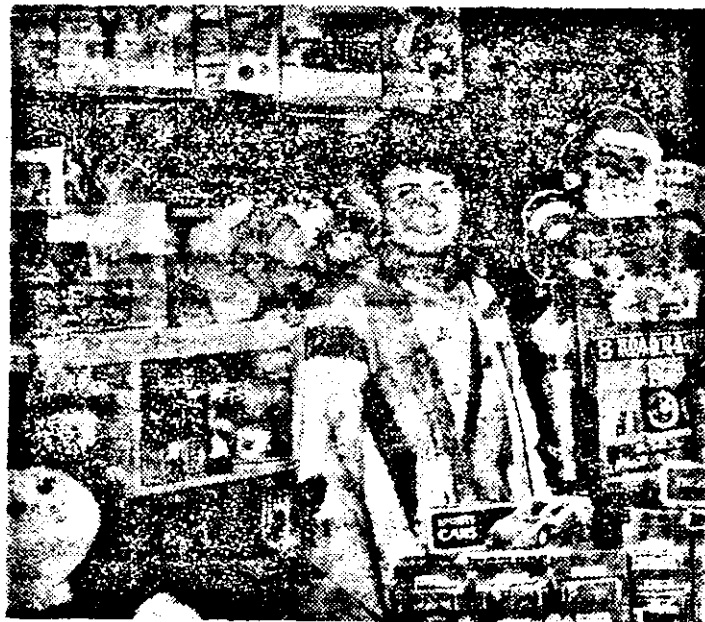
Secvență din expoziția cu vânzare „Daruri de Crăciun”, realizată de Camera de Comerț și Industrie, Prefectură, Consiliul județean și Primăria Arad. Expoziția este organizată în holul Palatului Cultural și este deschisă zilnic între orele 10-18, iar simbăta și duminica între orele 10-14.