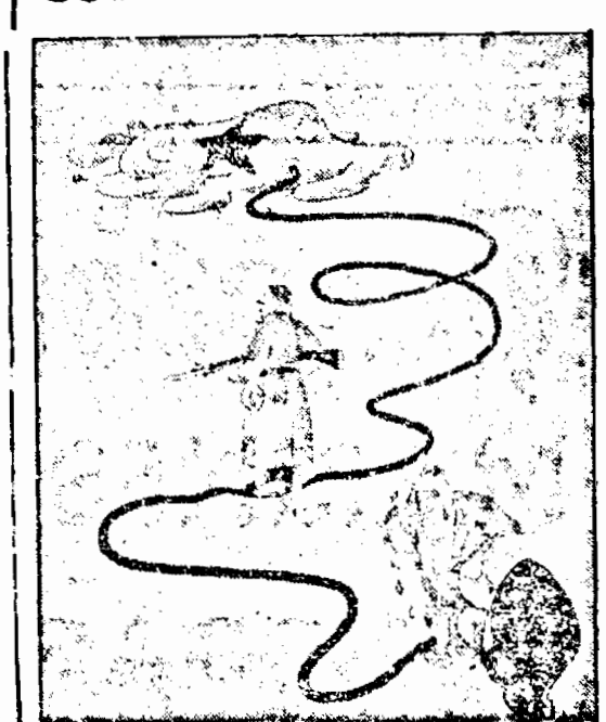
Asistența Rusiei, sau mica împerechiare

— „Este vorba, fără îndoială, de re- surse foarte mari, astfel în cât să asi- gure Axei avantajul care pot fi definite „formidabile”. L. O. DELFINO