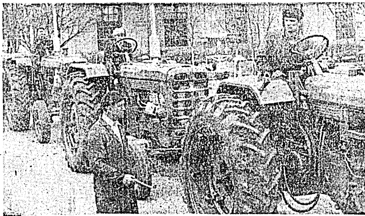
SMA Curtici: tractoare recent reparate, sint gata să înceapă lucrările din campania agricolă de primăvară.

Oamenii sint mai veseli, mai exuberanți. Prezentimentul primăverii le animă-n gânduri și frumosește în căminul pleoștău fiindcă primăvara totu e mai nobil, mai măreț, mai tînăr. Acum în aceste zile cînd la fiecare colț de stradă se vind ghiocei și viorele, vîrstele oamenilor