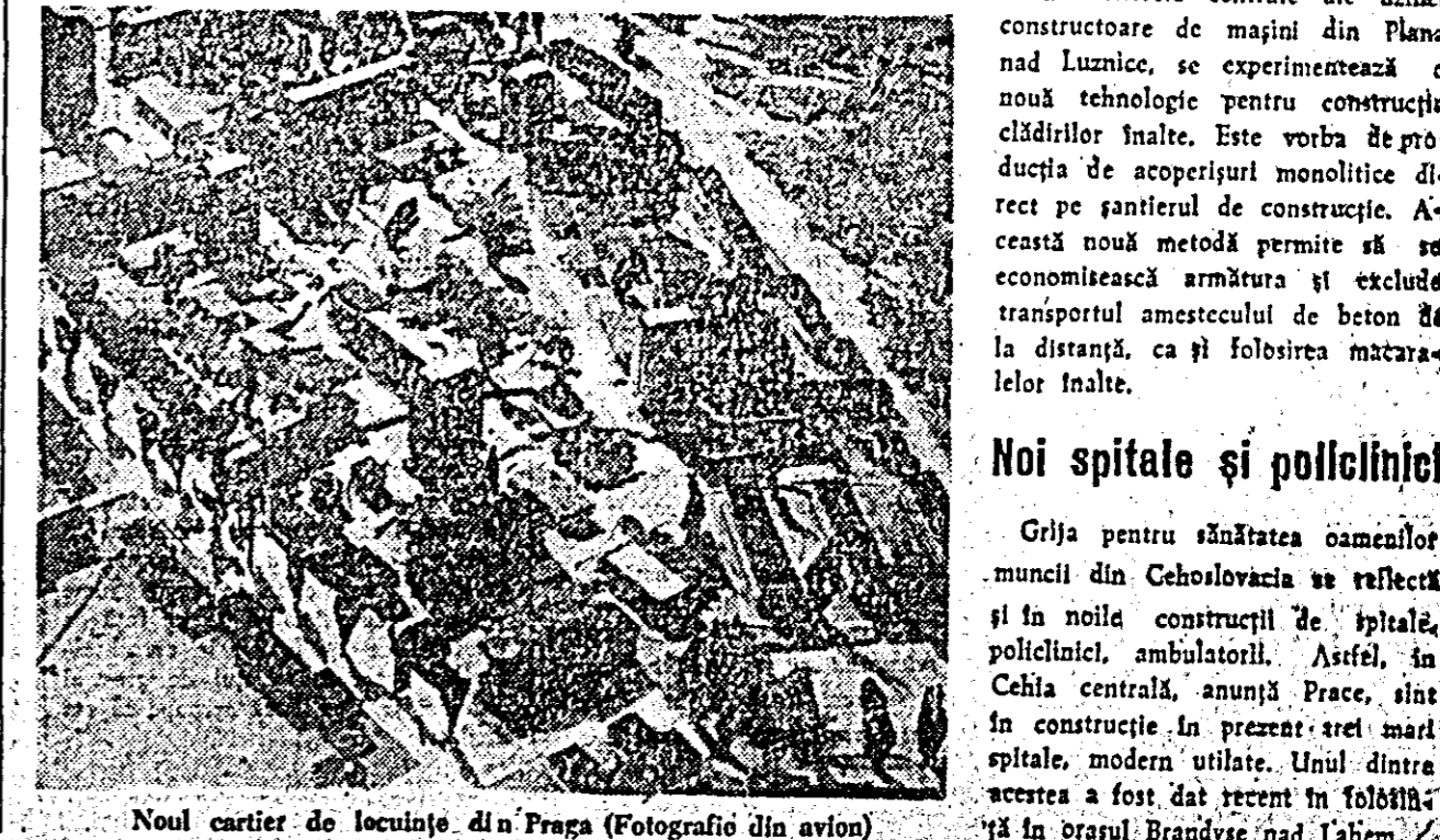
Noul cartier de locuințe din Praga (Fotografie din avion)

Grija pentru sănătatea oamenilor muncii din Cehoslovacia se reflectă și in noua construcție de spitale, policlinici, ambulatorii. Astfel, in Cehia centrală, anunță Praga, sînt in construcție in prezent trei mari spitale, modern utilate. Unul dintre acestea a fost dat recent in folosință in brașul Brandys nad Labem.