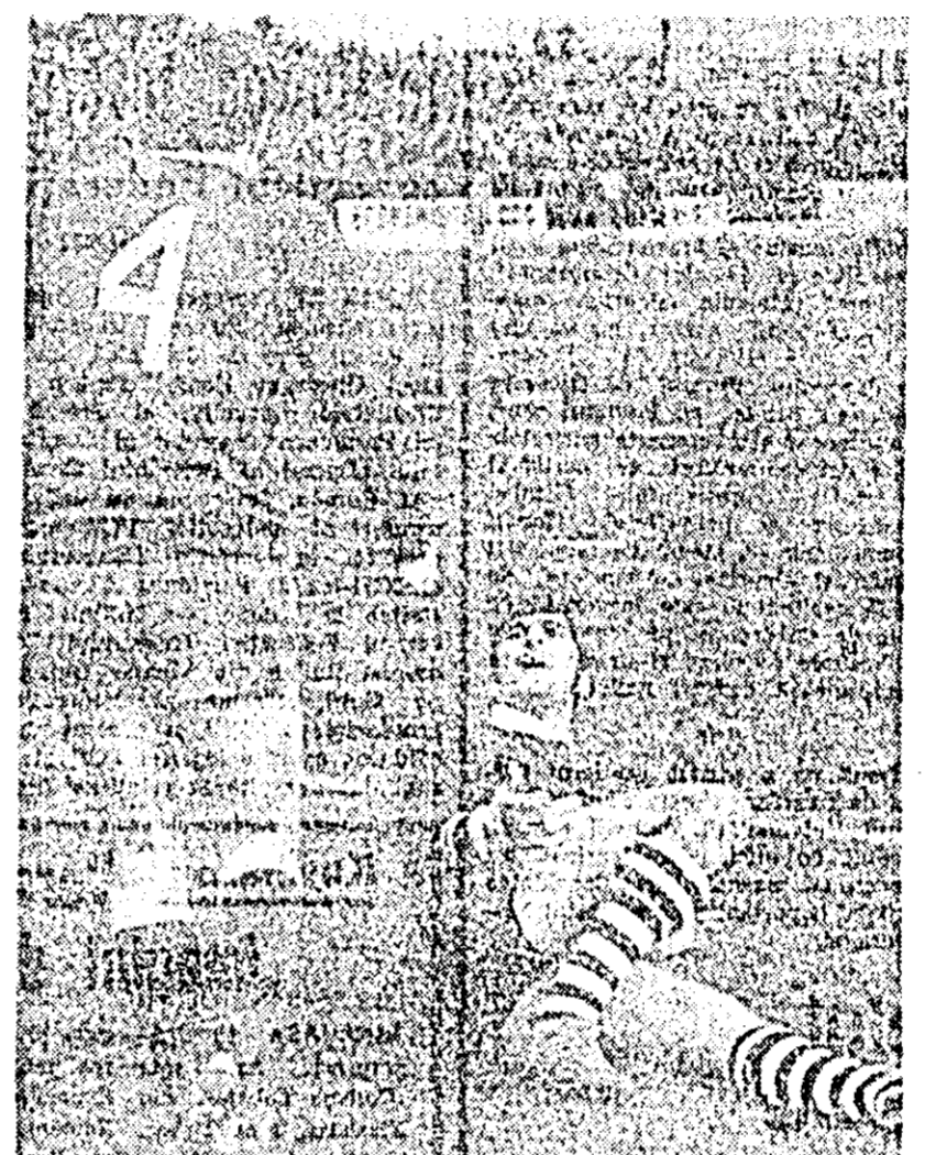
Fază din meciul UTA-Rapid.