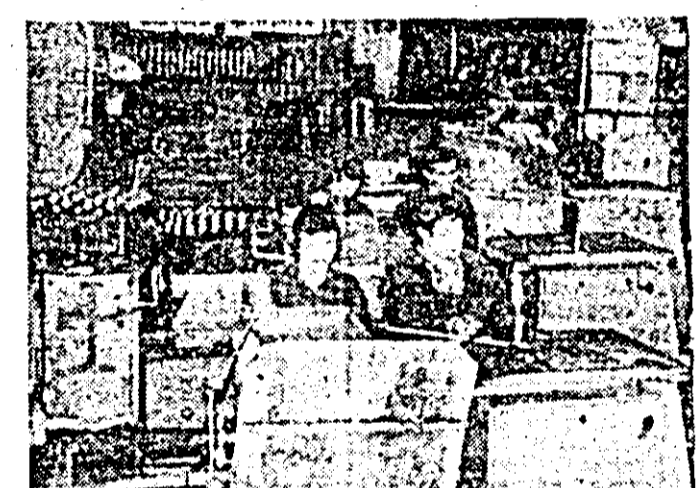
Sebiș. Aspect din secția de strunguri, intrată în producție în această legislatură.

loc la Sebiș și pe plan spiritual. Astlele, din cele 30 de mil de volume de carte existente în biblioteca ordșenească, anul trecut au fost împrumutate cîitorilor 29.000, iar prin librării au fost vîndute în ultimii cinci ani de zece ori mai multe cărți. Imaginea saltului fără precedent petrecut în nivelul de cultură și civilizație al oamenilor este și mai pregnantă dacă raportăm aceste realități la datele furnizate de o recentă monografie a orașului Sebiș din care rezultă că în anul de tristă amintire 1907, dintre toți locuitorii fostei așezări rurale, abia cîțiva știa „a citi și a scrie”.