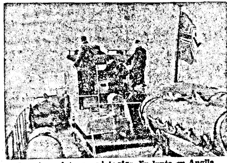
Un submarin se întoarce victorios din lupta cu Anglia.

torul focului și al spadei, se arată astăzi pe prispa catedralelor ceace este un semn al slăbiciunii lor. Bază navală americană în Irlanda Amsterdam, 12. (Rador). — Corespon- dentul agenției DNB transmite: „Reuter” află din Washington că se- natorul Taft a declarat Joi în Senat că a aflat acum câteva săptămâni dintr'un izvor demn de încredere, că Statele Uni- te construiesc în Irlanda de nord o bază aeronavală pentru Marea Britanie.