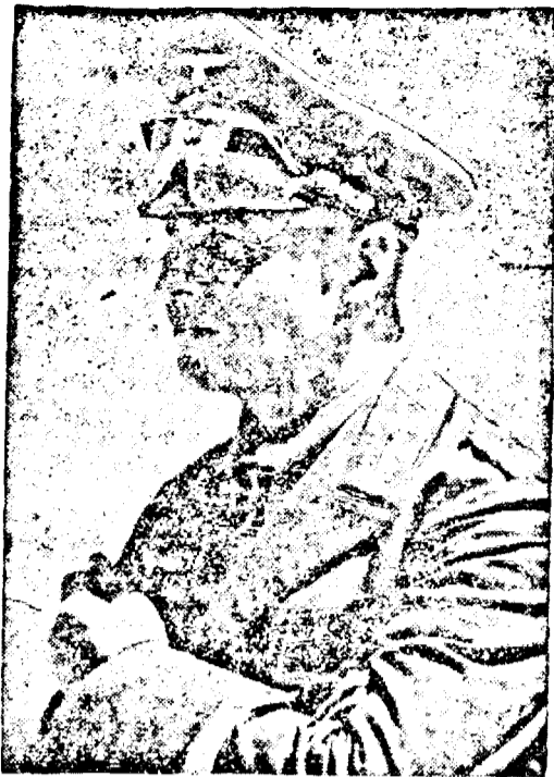
Generalul Rommel comandantul corpu lui expediționar german din Africa de Nord

Și astăzi, ca și în trecut soarta vrea ca rușii să fie alungați dela Mare. De astădată nu numai dela Baltică, dela Marea Neagră, ci poate chiar și dela Pacific.