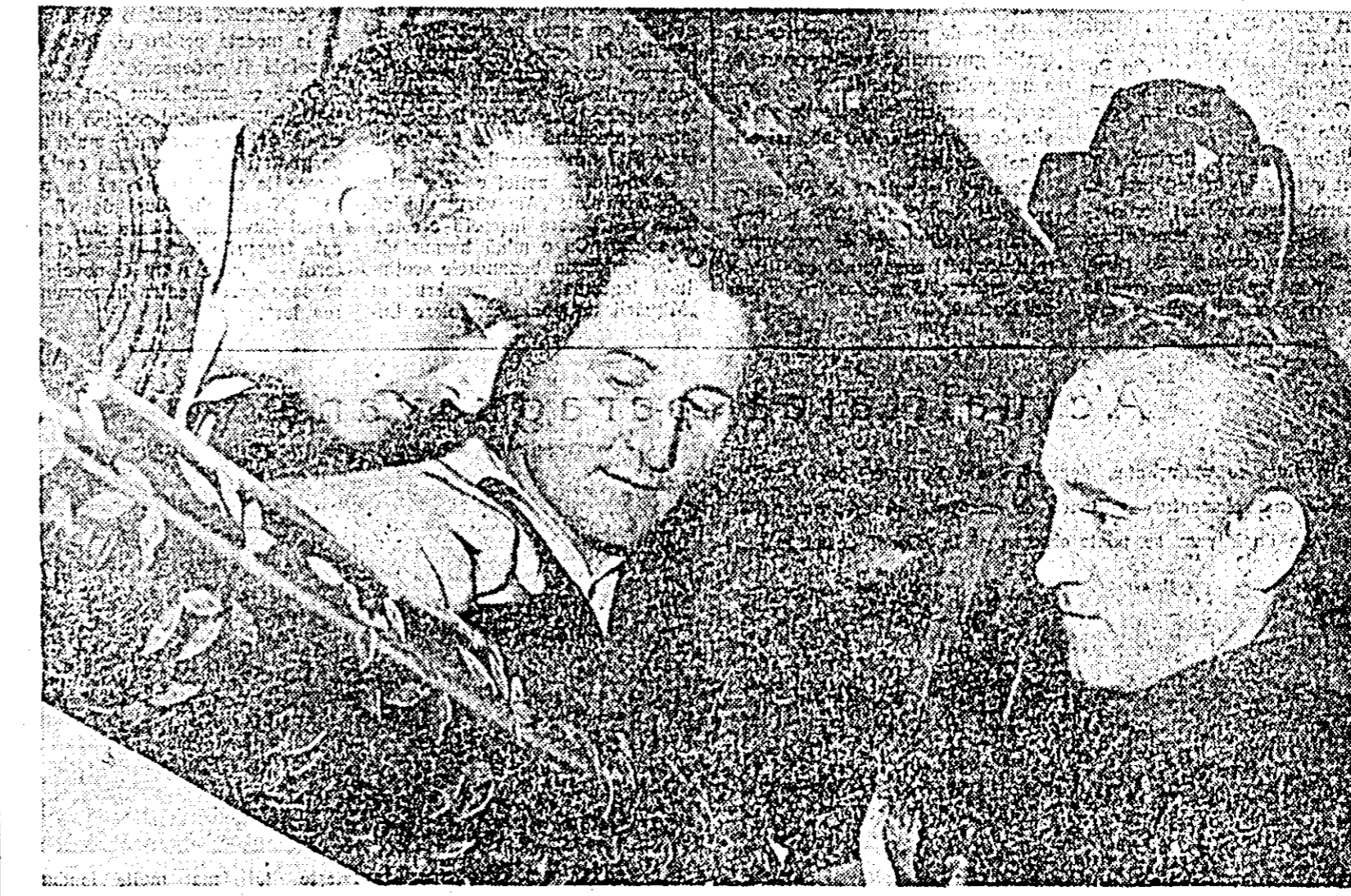
Vă prezentăm un aspect de la locul de muncă a trei muncitori din secția de galvanizare a Uzinelor „30 Decembrie”...