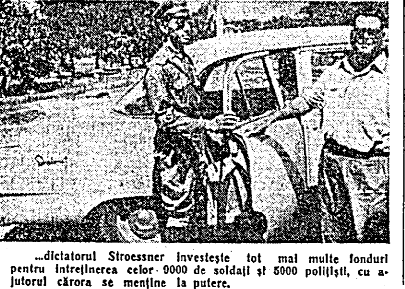
...dictatorul Stroessner investeste tot mai multe fonduri pentru înfrînerea celor 9000 de soldați și 5000 polițiști, cu ajutorul cărora se menține la putere.