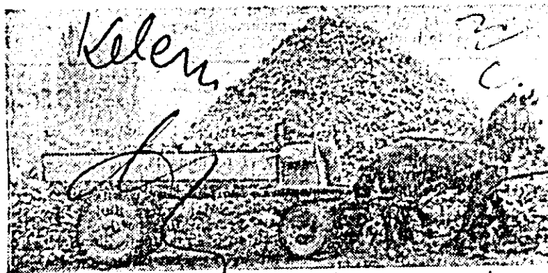
Recolta bună de sfeclă de zahăr se adună spre a lua drumul întreprinderii prelucrătoare.

Cu toate condițiile climatice nefavorabile, livezile județului au produs rod mulțumitor, cum este și cel de mere de la I.A.S. Lipova.