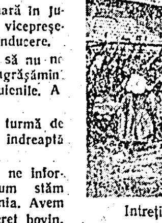
Întreținută la timp, cultura de tutun a dat o recoltă bogată.