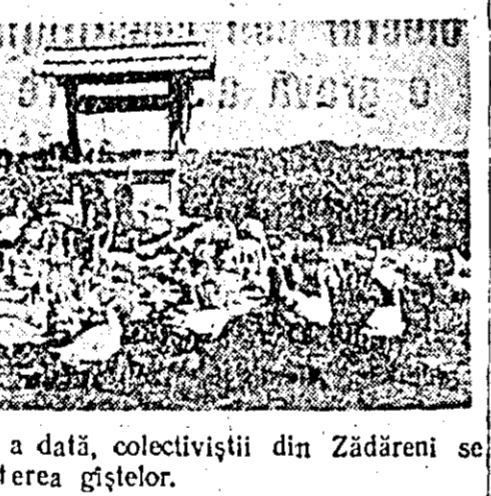
Pentru primă dată, colectivizii din Zădăreni se ocupă de creșterea găștelor.

constați cu bucurie că gospodăria colectivă din Zădăreni a pornit pe un drum bun. Multe din greutățile care au existat au fost învinse de forța unită a celor 204 fam. de colectivizii. În vîlmîmintele trase din lucrările constăturii de la Constanța stau acum călăuză în munca lor de fierare zi.