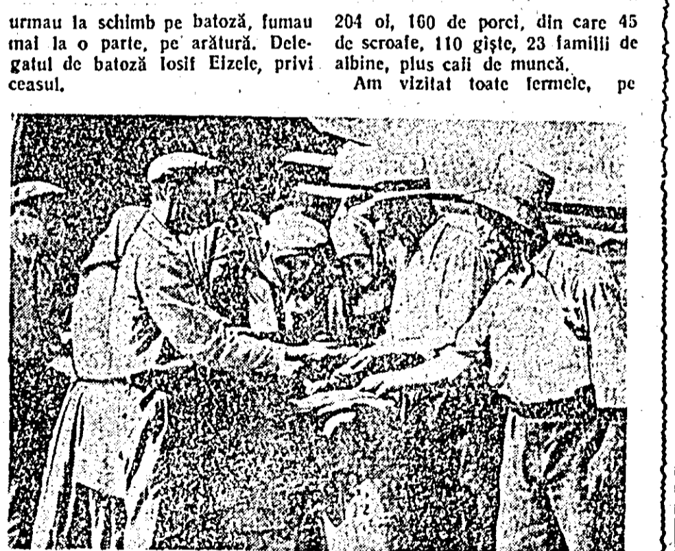
Griu ca aurul al colectivității din Zădăreni. Cu toții se bucură de rodul bogat al muncii lor.

LONDRA 28 (Agerpres). — La 26 Iulie a avut loc la Londra după o întrerupere de mai mulți ani, un mare concert dat în cadrul programului de televiziune de către Paul Robeson. El a interpretat cîntece ale negrilor, cîntece enrice, scoțiene, chineze și cele, precum și cîntece ale popoarelor din Africa. Robeson a recitat de asemenea monologul lui Othello din tragedia cu același nume de Shakespeare. După acest concert Paul Robeson va da concerte în cadrul a încă două programe de televiziune. La data de 10 august el va da un mare concert în sala Albert Hall din Londra.