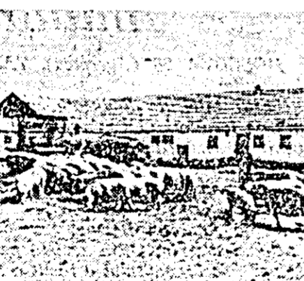
Creșterea porcilor e o preocupare care aduce mari venituri bănești gospodăriei colective.