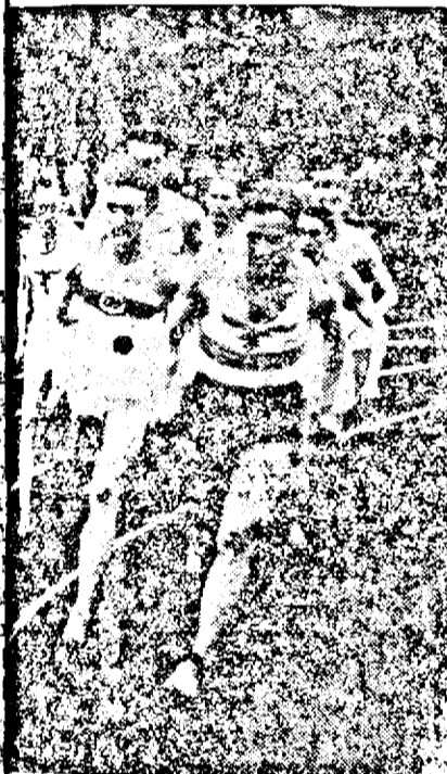
Germanul german Rudolf Harbig a stabilit un nou record mondial la 1000 m.