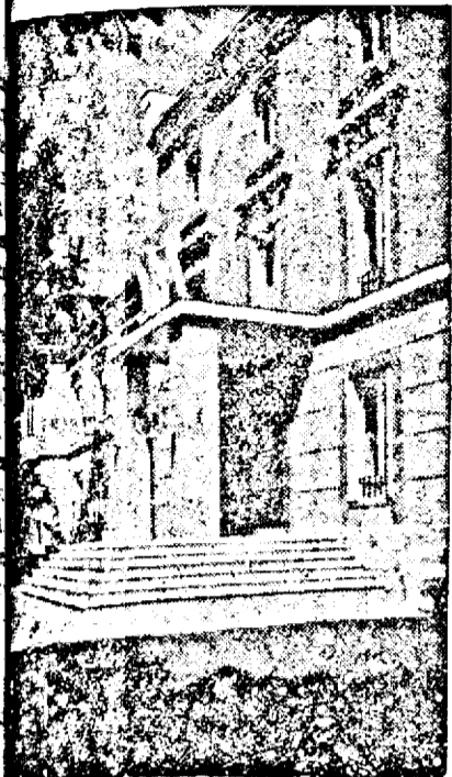
Centrul de cultură german din Madrid, recent inaugurat