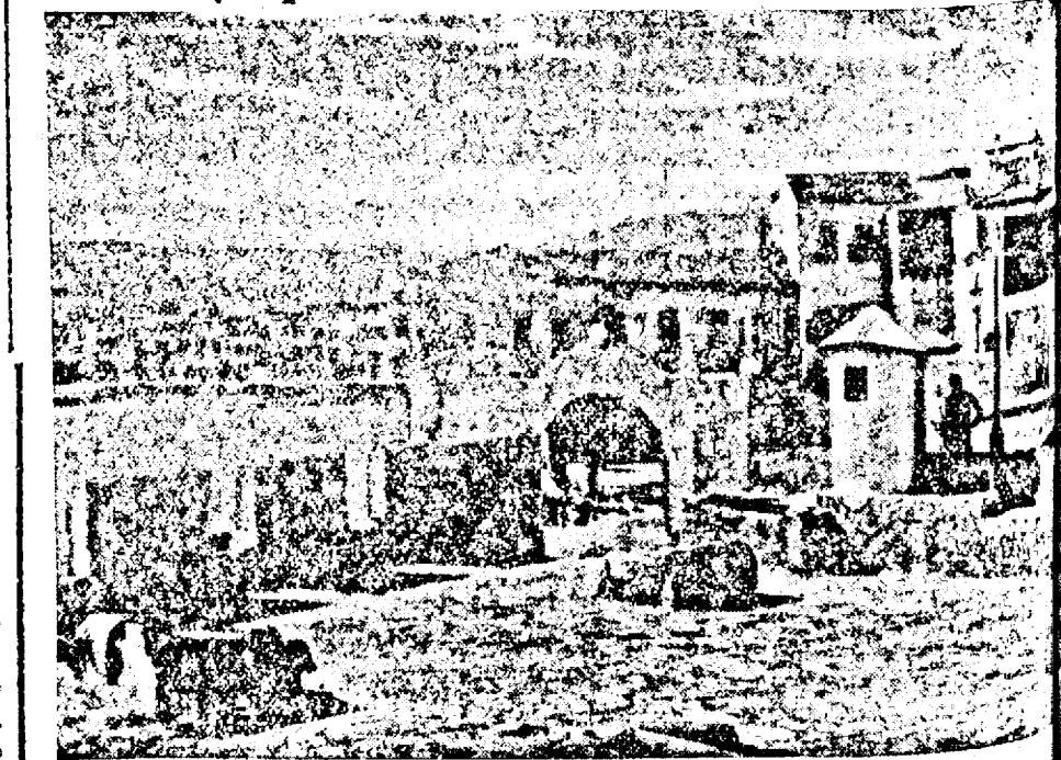
KANEA, capitala insulei Creta.