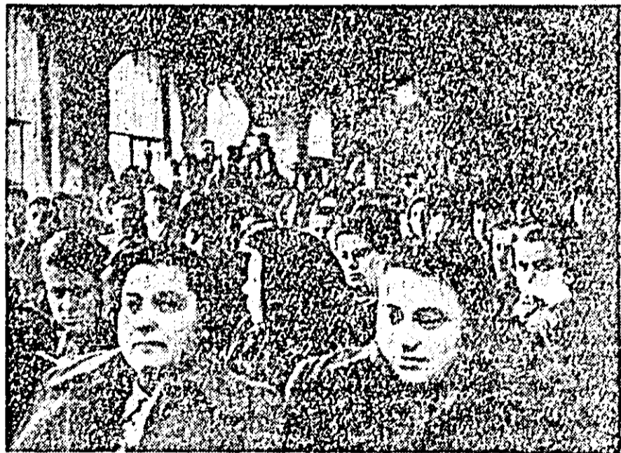
Zilele trecute în sala de ședințe a fabricii „Triceul roșu” a avut loc o însuflețită adunare populară consacrată alegerilor de deputați în sfaturile populare.

Participanții la miting și-au exprimat hotărîrea pentru consolidarea succesorilor de pînă acum și pentru dezvoltarea lor pe mai departe, pentru viitorul lor fericit și luminos, să-și dea votul pentru candidații Frontului Democrației Populare.