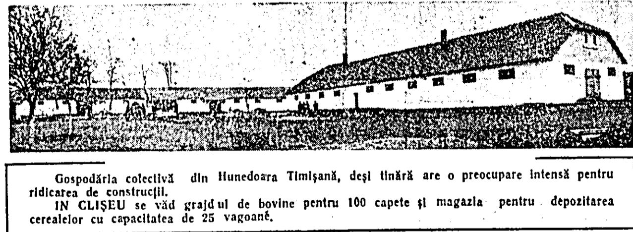
Gospodăria colectivă din Hunedoara Timișeană, deși tînără are o preocupare intensă pentru ridicarea de construcții.

muncă voluntară, timp în care s-au cărăit 343 metri cubi de piatră spartă și s-au asfăltat pe drum. La extinderea iluminatului electric pe o distanță de doi km s-au efectuat, de asemenea, aproape 100 zile muncă voluntară. Au fost reparate și altele înspre Hunedoara Timișeană și satul Crucii și s-au plantat 1200 de pomi. Contribuția voluntară bănească și cea manuală asigură buna gospodărire și instrumusecare a comunei.