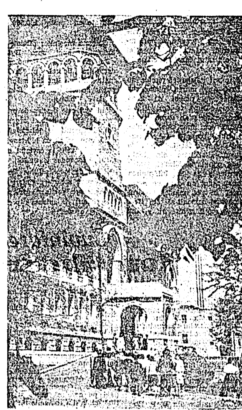
Aspect exterior al Muzeului de istorie a partidului.