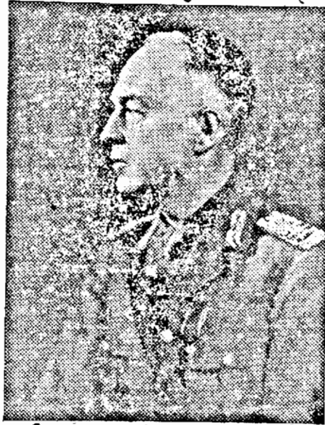
D. GENERAL I. ANTONESCU Conducătorul Statului Român

sovietele — care nu au îndrăznit să re- vendice în timp de pace aceste două