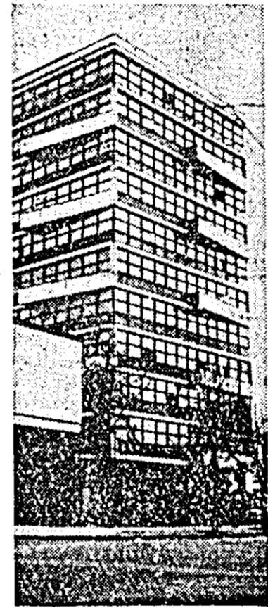
Două imagini din capitala RSP Iugoslaviei. Căldirea Adunării Municipale a districtului Belgrad, clădire recent construită (dreapta) și noua clădire a Facultății tehnologice (stînga).

În legătură cu situația din mișcarea de eliberare națională din Angola, în mesaj se arată că „țările neafricane” folosesc așa-numitul guvern revoluționar angolez în exil condus de Roberto Holden (cu sediul în Leopoldville — n. r.), ca o unealtă pentru permanentizarea scizunii din mișcarea de eliberare națională din această țară. Conducătorii acestui „guvern”, menționează mesajul sabotează în mod sistematic activitatea comisiei de reconciliere dintre cele două principale grupuri ale mișcării de eliberare națională din Angola — MPLA și Uniunea popoarelor angoleze.