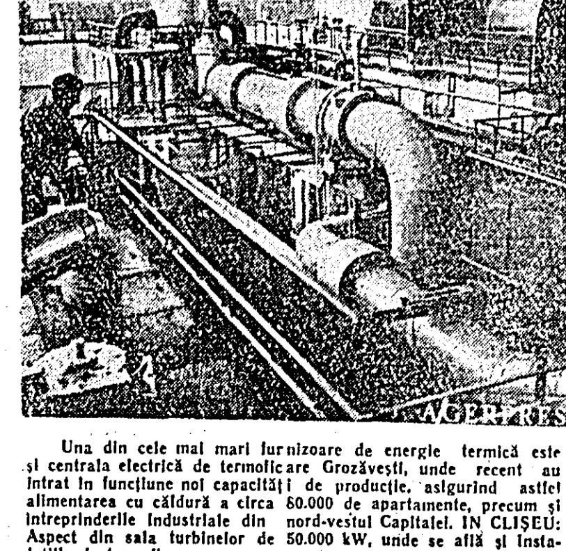
Una din cele mai mari furnizoare de energie termică este și centrala electrică de termoficare Grozăvești, unde recent au intrat în funcțiune noi capacități de producție, asigurînd astfel alimentarea cu căldură a circa 80.000 de apartamente, precum și întreprinderile Industriale din nord-vestul Capitalei. ÎN CLĂȘEU: Aspect din sala turbinelor de 50.000 kW, unde se află și instalațiile de termoficare.