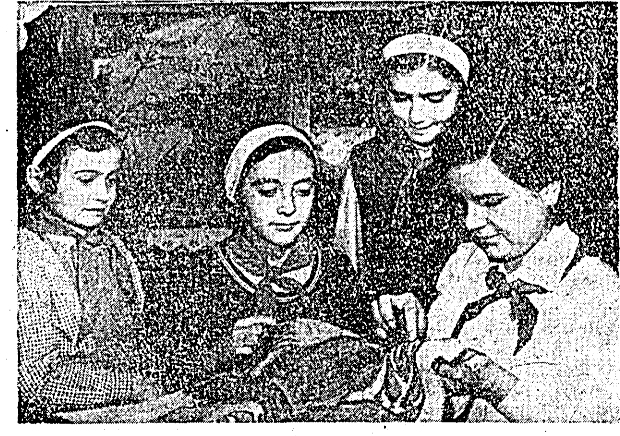
Activitate pasionantă la cercul minilor Indemnatice de la Casa pionierilor.