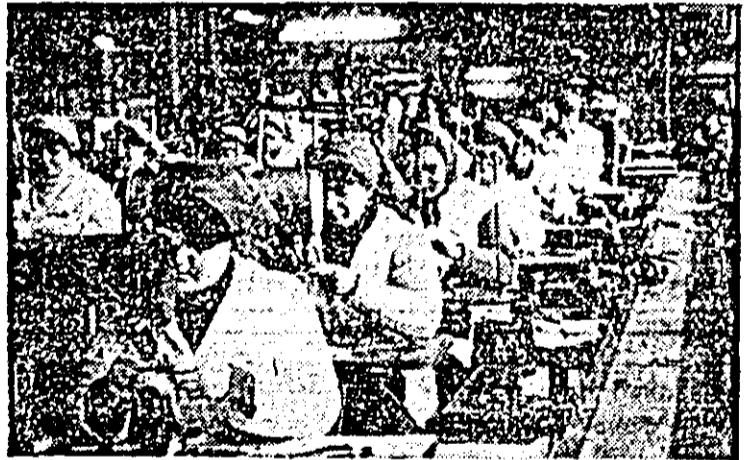
Aspect din atelierul pregătit-cusut fețe de la întreprinderea „Libertatea”.

Ce importanță are respectarea programului de lucru, utilizarea lui cu maximum de eficiență, eliminarea inoventelor — cu sau fără rost — s-ar părea că nu mai trebuie s-o subliniem. Zicem, s-ar părea, deoarece dacă majoritatea covârșitoare a celor ce muncesc înțeleg pe deplin însemnătatea unor asemenea comandamente, mai există unii pentru care a-ți lua o oră sau o zi liberă, fără nici o aprobare sau justificare constituie un lucru banal, oarecare. Exact ceea ce se poate vedea și în raidul de mai jos organizat recent cu sprijinul Miliției municipiului Arad.