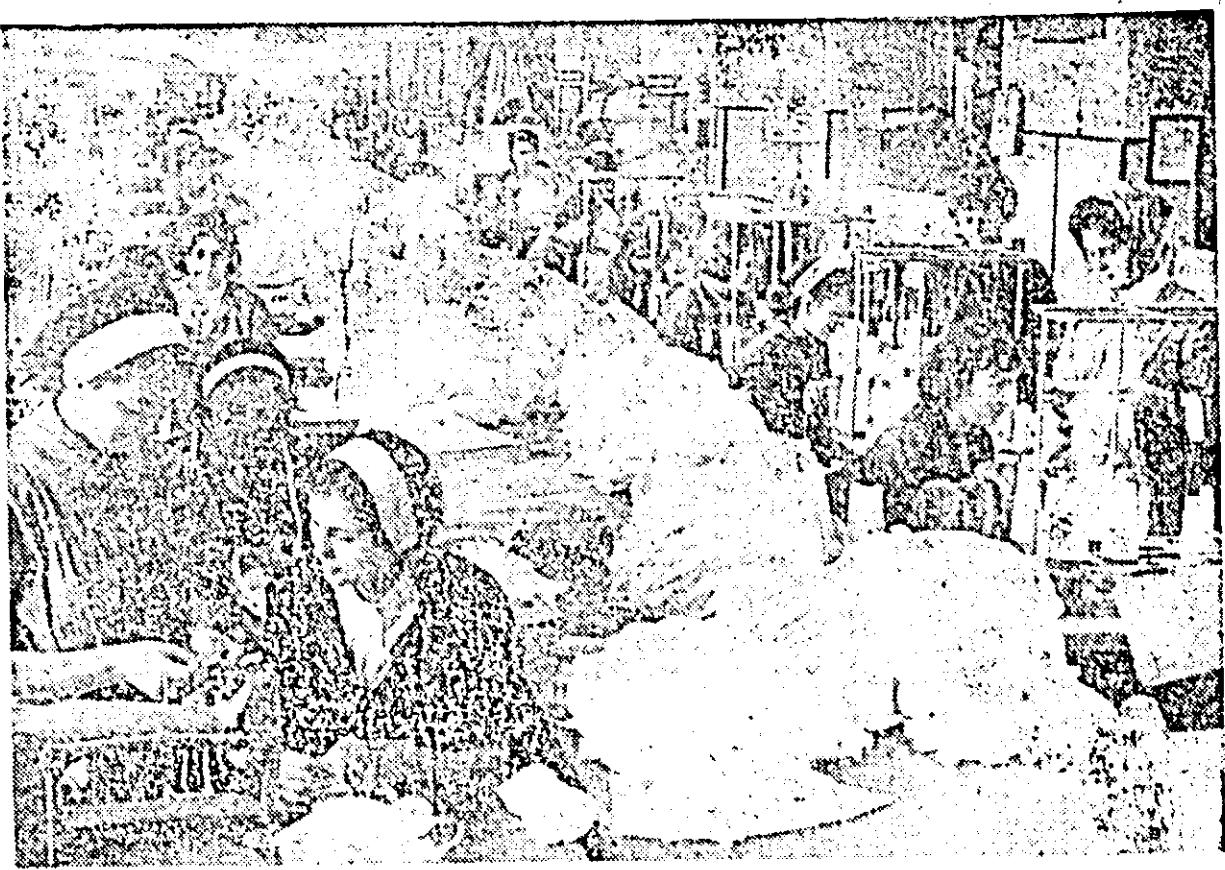
Aspect din secția confecțiilor a fabricii „Tricoul roșu”.