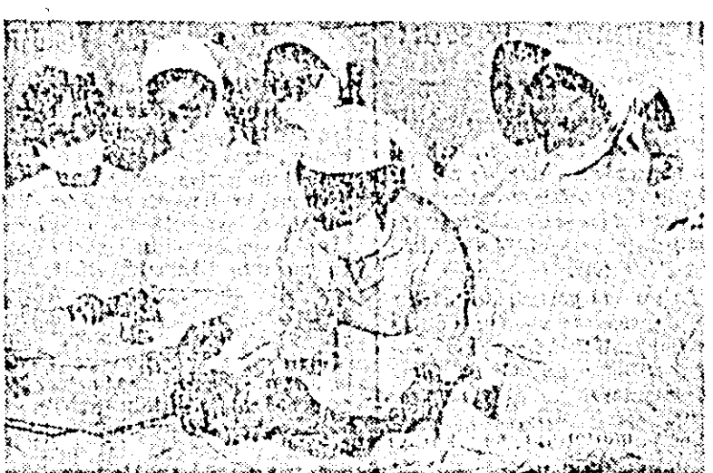
La ora practică de îmblăiere și înfășurare a noului născut.

O adevărată armată a halatorilor albe. Medici, surori, asistente. Se mișcă abia simții pe sălițele și în saloanele immaculate. În dimineața aceasta, ca de altfel oricînd, le și în toată nopților. Îi găsești pretutîndeni: la patul unei gravide, gata să aducă pe lume o nouă viață. Într-o sală de consultație gonind boala cu armele lor puternice — și lină, răspundere, omenie sau, într-o simplă sală de cursuri sanitare.