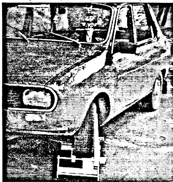
Cam așa arată sistemul de „convingere” folosit de Parktronic - o idee chiar câinească!

- Deci, se pot constitui și la noi aparate care să elibereze cartele și pentru subdiviziuni ale orei așa cum am văzut în Franța, în Blois, de pildă, un orașel ceva mai mic ca Aradul și unde aparatele pentru taxat - pe