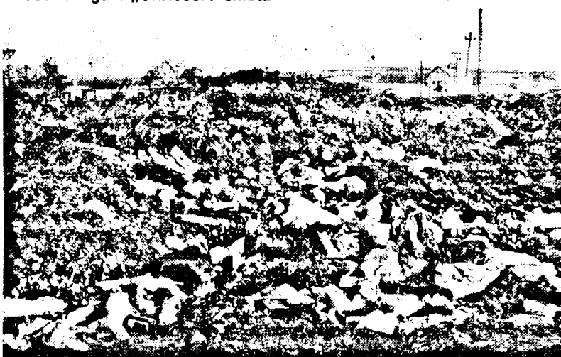
Gunoiul să devină „mărul discordiei”?