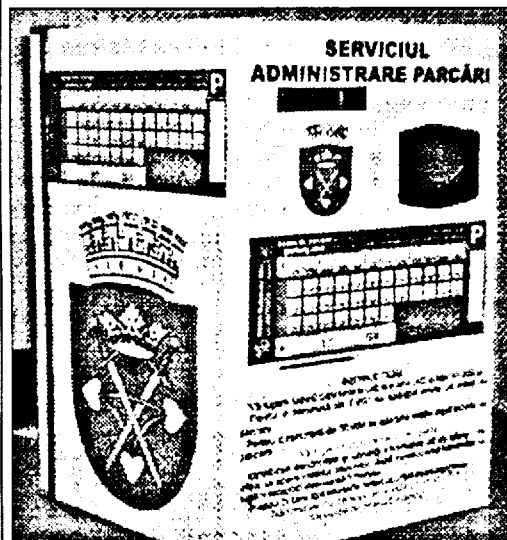
Automatul pentru tichete de parcare produs la Arad, dar care se folosește oriunde în țară, doar puțin la Arad din motive pe care doar Primăria le știe!

bulevardul principal, dincolo de Primărie, am văzut un autoturism cu însemne de Elveția care avea roata blocată de către „vigilenții” de la Parktronic, bietul șofer nestind cu ce a greșit și spre a povesti probabil dincolo ce a pățit în