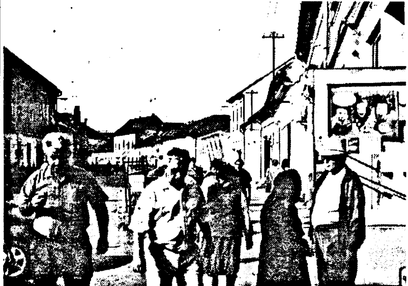
Un oraș cu aer de comună