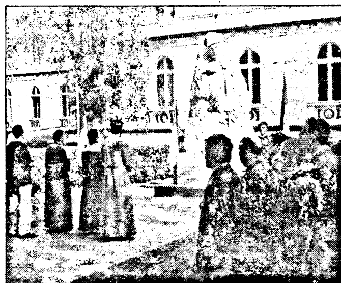
Ieri, au avut loc depunerile de coroane la statuia lui Avram Iancu