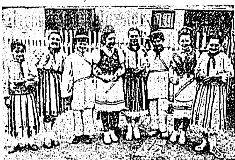
IN CLIȘEU: Un grup de participanți la concurs.

SOLO INSTRUMENTE: Școli de 7 ani: 1. Covășinț — Luca Petru, 2. Curtici. Școli de 4 ani: 1. Mîndruoc, 2. Zădăreni.