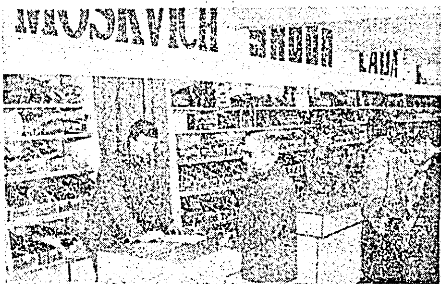
Un nou și modern magazin, care interesează pe automobiliștii s-a deschis recent în Piața UTA.