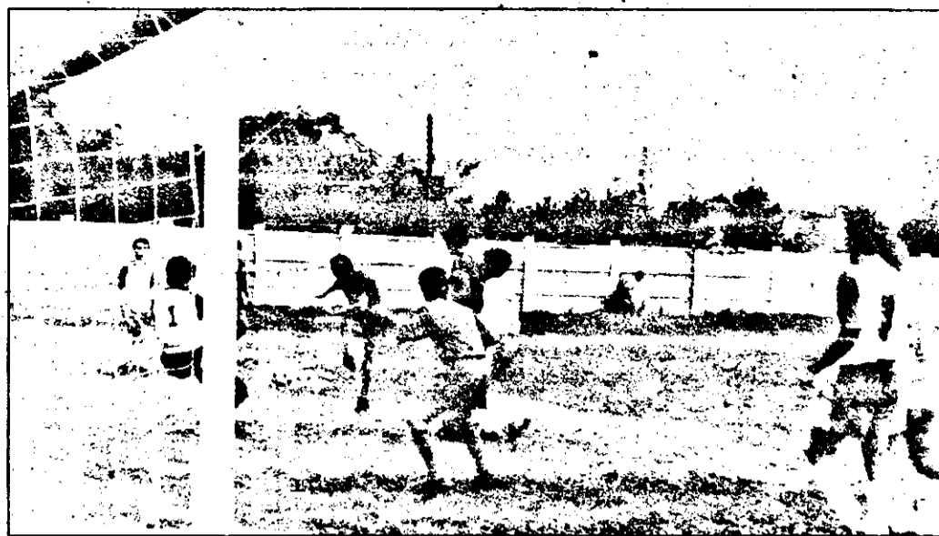
Un nou gol din seria celor șapte înscrise de Indagrara