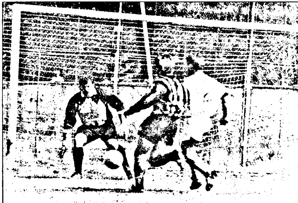
Astra - CPL Arad

La reluare Astra domină mai mult, Boloș își ia parcă rolul mai în serios dar tabela de scor rămâne neschim-