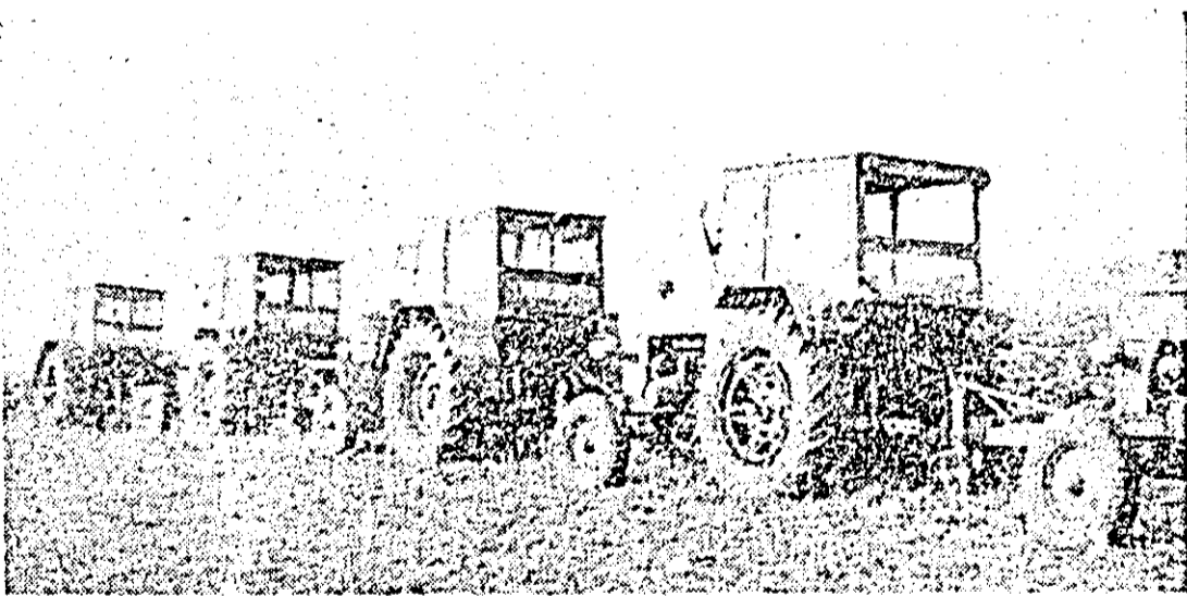
Ample forțe sînt concentrate la arături și în unități din consiliul unic Chișineu Criș.