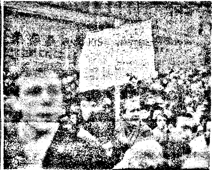
Arad, 22 decembrie 1989; Voința poporului. Fotografie primită de la MIRCEA IANCAU, Arad