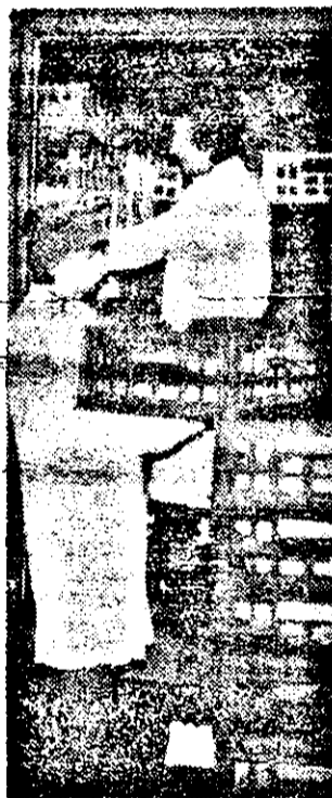
19 mașini asigură, ziua și noaptea, transportul operativ al pîinii către populație.

400 tone de carne, la care se adaugă alte 35 tone de carne și produse din carne