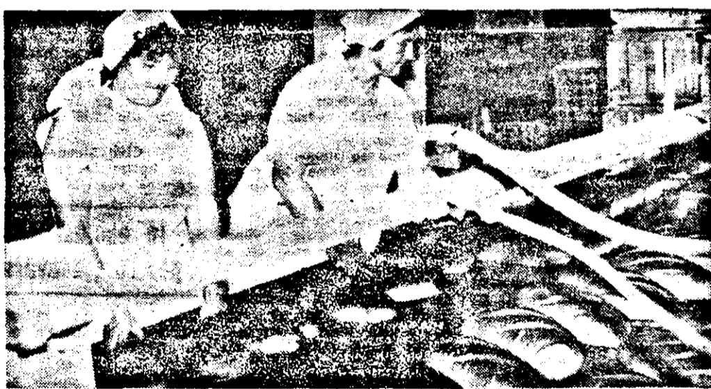
Piinea noastră cea de toate zilele, așa cum ne-am dorit-o: albă, proaspătă și în cantități îndestulătoare.

Deși amintirea zilelor fierbinți ale celui atît de înălțător decembrie continuă să stăruie în mintea și sufletele noastre, deși rănila lăsată de odioasa dictatură ceaușistă încă nu s-au vindecat, viața, viața cea cu adevărat nouă începe să-și arunce albia ei firească. În fabrici, pe stradă, în fiecare sector de activitate liniștea și munca și-au reintrat în drepturile lor firești. Exact ceea ce ne-am propus să surprindem și noi în fotoreportajul de față.