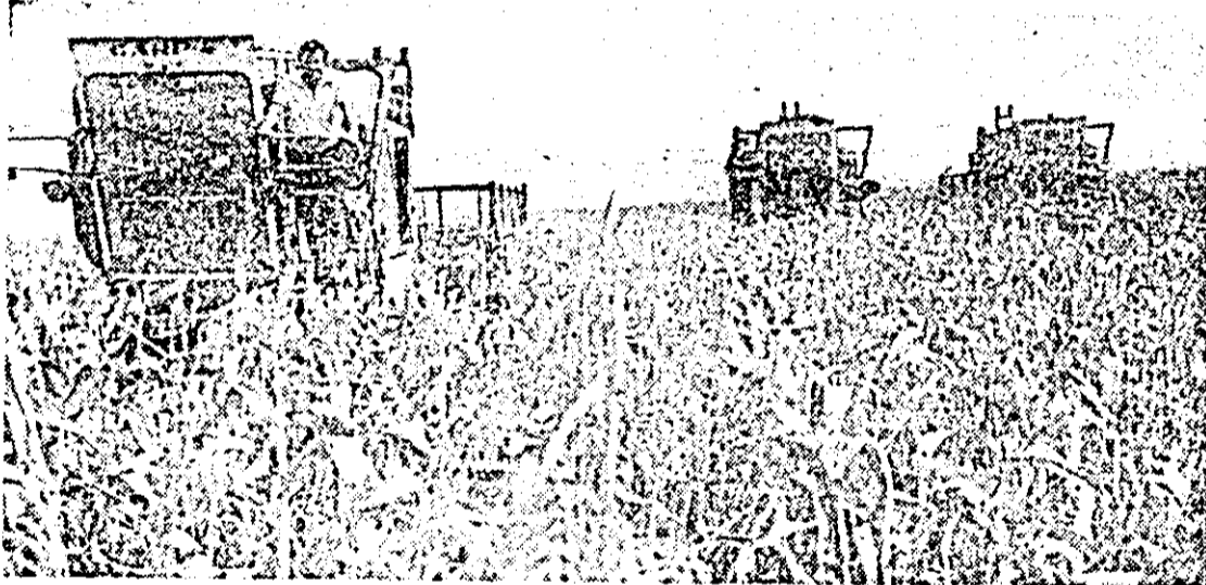
La ferma a VIII-a a I.A.S. „Scînteia” se acționează din plin la recoltatul porumbului.

toamnă care s-au efectuat pe mai bine de 103.000 ha, cu rezultate bune aflîndu-se consiliile unice din Nădlac, Felnac, Vinga, Ineu, Lipova, Sebiș, dar se semnalează rămîneri în urmă la Curtici, Săvrîșin, Cănanont, Beliu și altele. În același timp se cere impulsional ritmul de lucru la semănatul culturilor de toamnă care s-a efectuat pe 21.150 ha, orzul fiind pe sub brazdă pe 22 la sută din plan, unitățile din C.U.A.S.C. Ineu, Nădlac, Sînlăni, Arad, Sebiș fiind mai avansate, însă lucrarea nu a început încă în unitățile cooperatiste din consiliile unice Curtici și Vinga, unde trebuie luate măsuri urgente pentru executarea semănatului.