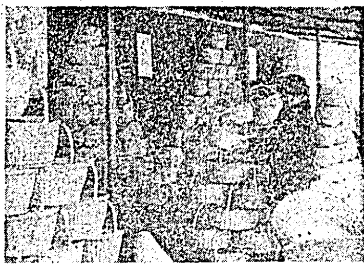
I.A.S. Flăinele. Aspect din expoziția permanentă a secției de împletituri a întreprinderii.