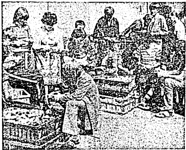
Elevi al Liceului Industrial nr. 5 dau ajutor la conservarea legumelor la I.P.L.I.F. „Relacerea”.