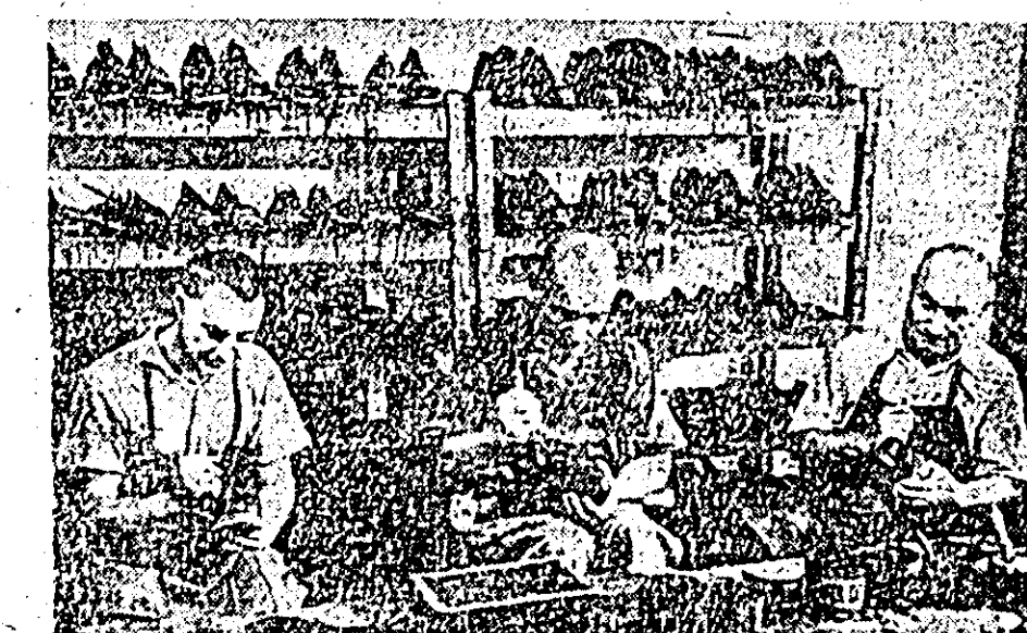
ÎN CLIȘU: un aspect din secția curății și vopsirii unde se lucrează la noul sortiment de pantofi. Pe raftul din spatele lucrătorilor se văd așezate perechi de pantofi tip „Golzer”.

în serie a unui nou sortiment de pantofi bărbătești tip „Golzer” foarte buni și frumoși, cu talpă și cusătură dublă.