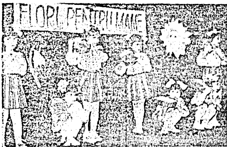
„Flori pentru mame” lăd genericul sugestiv sub care șoimii patriei de la grădinița de copii a întreprinderii de sare au prezentat un emoționant spectacol, dedicat zilei de 8 Martie. În fotografie: un moment din acest deosebit de reușit spectacol.