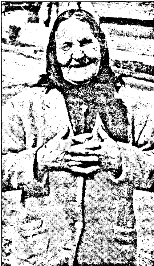
„Ajută-i, Doamne, pe rromi!”