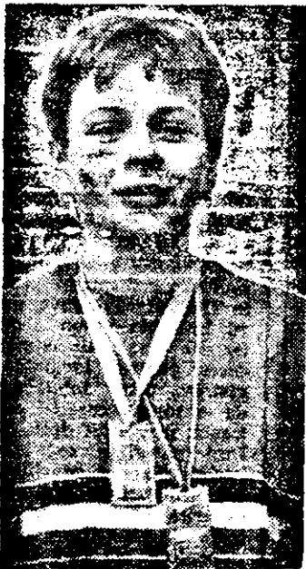
una din elevele frumuse la Școala generală nr. 5 Arad.

Iată că tradiția judoului masculin arădean, confirmată de atîtea ori în întrecerile internaționale, este dublată de ascensiunea tot mai rapidă a judoului feminin, cu preponderență prin performanțele obținute de sportivii de la CSS „Gloria” Arad. Vorbind de judoul feminin, să amintim că primul titlu național a fost obținut de Diana Ciupe, talentata baschetbalistă de la Constar — Universitatea Arad. Performanța Angelei Chifor vine să completeze această performanță și oferă imaginea unei sportive de talent, sîrguincioase pe tatami, care îmbină în mod armonios sportul cu învățătura, Angela fiind