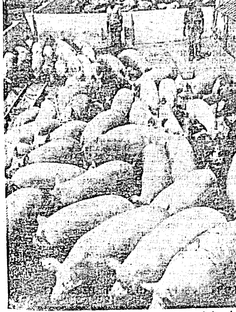
Unul din sectoarele puternice ale gospodăriei agricole colective „Ogorul” este și sectorul zootehnic.

lectivist, care și-a pus la temelia ei contribuția personală și încrederea în viitorul și mai luminos al patriei aflată pe drumul desvirării construcției socialiste.