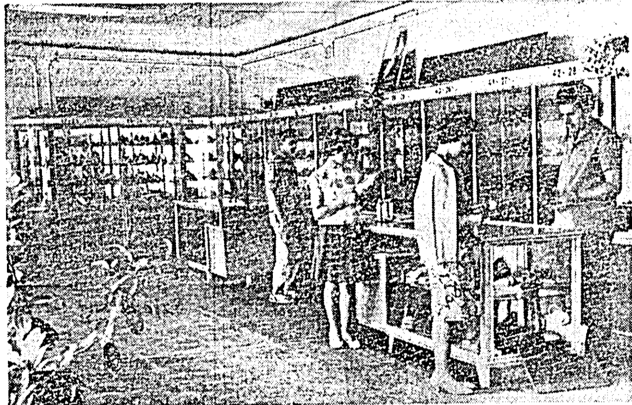
IN CLIȘEU: Aspect din interiorul magazinului specializat, deschis de curînd.

Printre realizările de ordin edilitar înălțate recent în comună, cu ajutorul deputaților și al cetățenilor, se numără terminarea lucrărilor de canalizare a fîntînilor publice, executarea de trotuare în lungime de 4 km și altele.