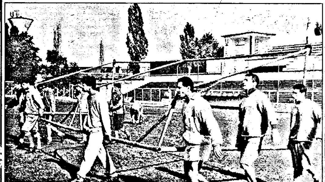
Jucătorii U.T.A.-ei, cărând din greu „poarta care le crează coșmaruri”. În timp ce într-a lor intră o mulțime de goluri, în cea a adversarilor „cad” extrem de puține. Poate la poalele Ceahlăului!