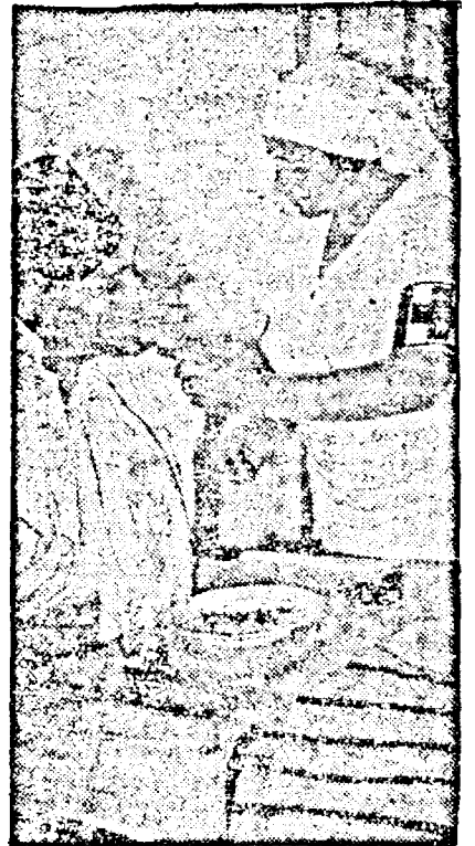
Intr'un spital pe front. O infirmiera de mâncare unui soldat lipsit de ambele brațe.

Dar din punct de vedere religios, moral și național vom avea de spus multe, — altădată.