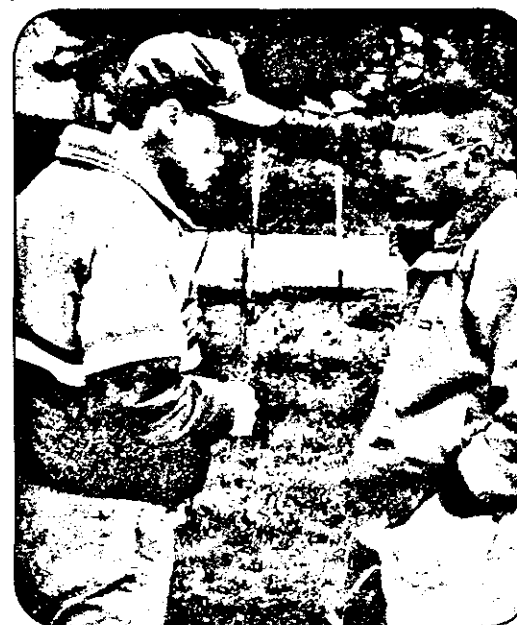
Într-o pauză, un schimb de impresii între profesor și elev.

Pagina prezintă rezultatele CONFERINȚEI NAȚIONALE DE