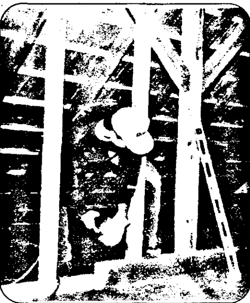
Atunci când folosești ciocanul pneumatic și într-un minut bați 20, 30 sau chiar 40 de cuie, nu e de mirare că întreaga mansardare va fi terminată în cel mult cinci zile. În plus, nici nu riști să-ți dai peste degete...