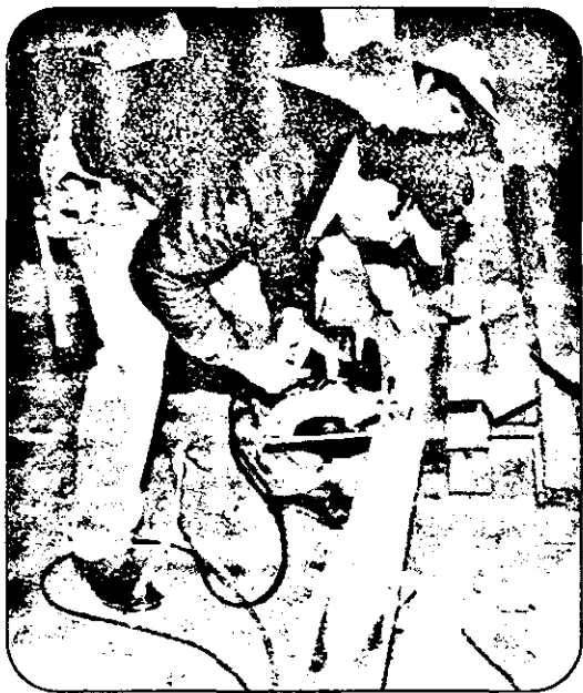
Repede și bine, cu utilaje tehnologice moderne, adică așa cum i-a învățat și le-a impus tinerilor americani societatea din care fac parte.