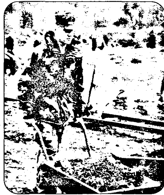
Copiii americani nu consideră că munca la târnăcop ori la roabă ar fi una rușinoasă, ba dimpotrivă este făcută cu seriozitate, ca orice altă activitate. Chestie de mentalitate...