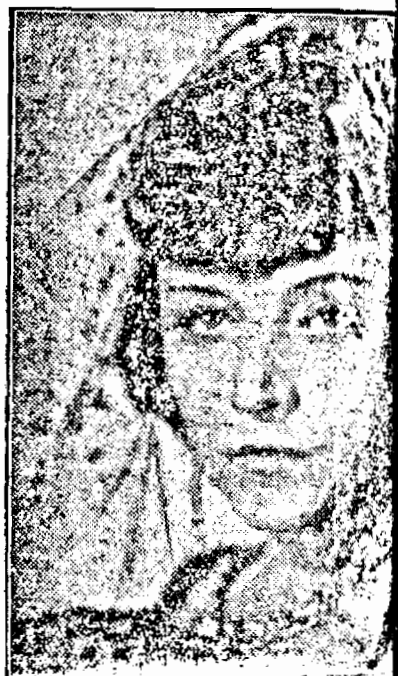
Pola Negri celebra tragediană de poloneză, care filmează actualmente în Germania

Scepticul Albrecht Schönhake totuși că a fost scăpat dela o moartea din acele tainice țări. Faptul s'a petrecut acum ani. Aflându-se la Londra, voi bată Marea Măneacă cu avionul. În ultimul moment, o presimțire ternică decât el, îl sili să renunțios de lașitatea lui, luă vaporul și însă se felicită pentru hotărârea ajun, aflând din ziare că avionul urma să se imbarce se prăbușimare, împreună cu toți pasagerii.