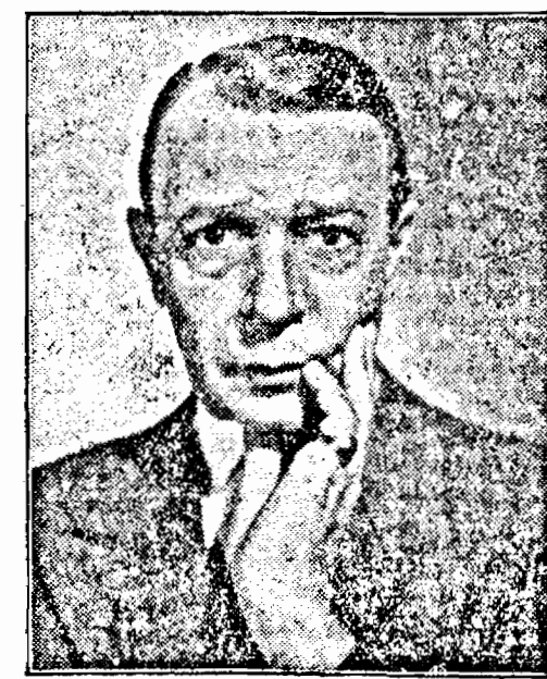
Renumitul comic german Georg Alexander, care a vizitat și orașul nostru acum câțiva ani

Ca de obicei, în Sâmbăta aceea îmi luasem geanta și mă pregăteam să plec, când deodată, am avut sentimentul unei catastrofe care mă amenința. Parcă auzeam pe cineva că îmi șoptește: nu