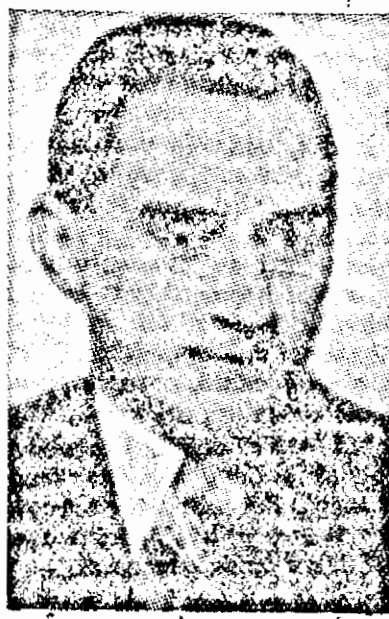
D. MIHAIL ANTONESCU vice președintele consiliului de miniștri

Discursul nostru este înmăntat de luptă și de jertfă. Din înaltul lui, pe aripi de vite, eroii noștri au primit cu freacă și cu mândrie de a lupta pentru Ceșcunesc și de a muri pentru el.