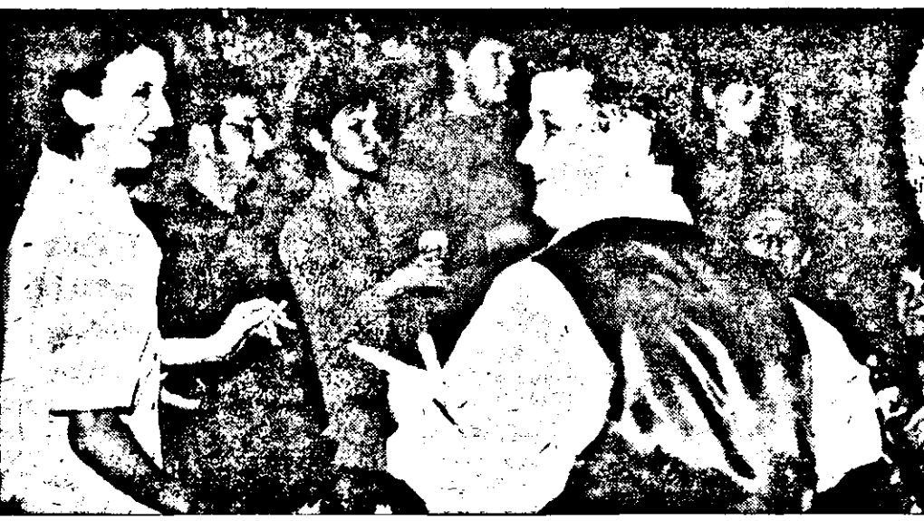
La Mega-Sfinx, după o emisiune istovitoare, se relaxează și colegii de la Televiziunea Arad

C. TRIF S. GHILEA D. SCRIDON