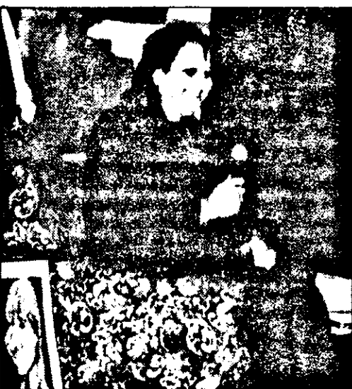
Cea mai bună caricatură a lui Popa's. Maestrul zâmbind...