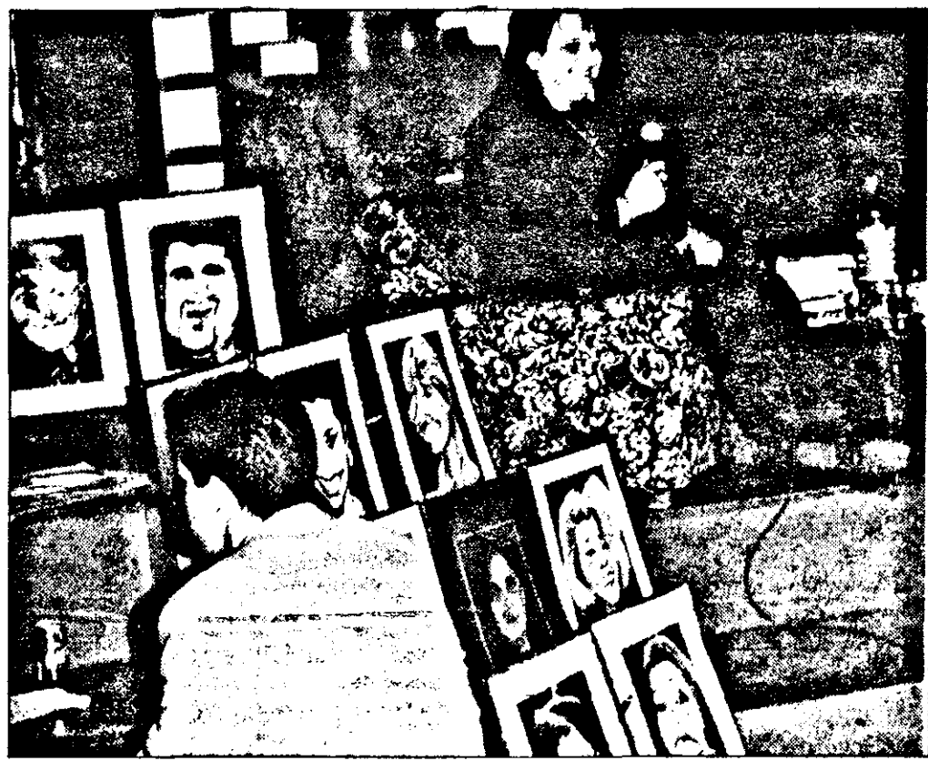
Cel mai rapid caricaturist din lume, în showul „Fii cu ochii pe noi”, și operele sale...